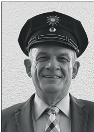
Peter Hahne TV-Moderator und Bestseller-Autor, Ehrenkommissar der Bayerischen Polizei und der Christlichen Polizeivereinigung

L iebe Leserinnen und Leser, es ist rund 60 Jahre her, da kamen uniformierte Polizisten zu uns in die Grundschule. „Verkehrserziehung“ nannte sich das. Aber es war viel mehr: Wir bestaunten die „Bewaffnung“ der Beamten und die Dienstwagen, die draußen mit Blaulicht und Martinshorn auf dem Schulhof standen. Wir erfuhren nicht nur, wie man eine Straße überquert oder Gefahren richtig einschätzt. Viel mehr! Wir lernten Respekt und Hochachtung vor einem Beruf, in dem der Beamte damals wie selbstverständlich „Schutzmann“ hieß. Der Polizist war der Freund und Helfer. Das ging in Fleisch und Blut über: Ein Uniformierter war immer für uns da und meinte es gut. Und deshalb zollte man ihm Anerkennung.